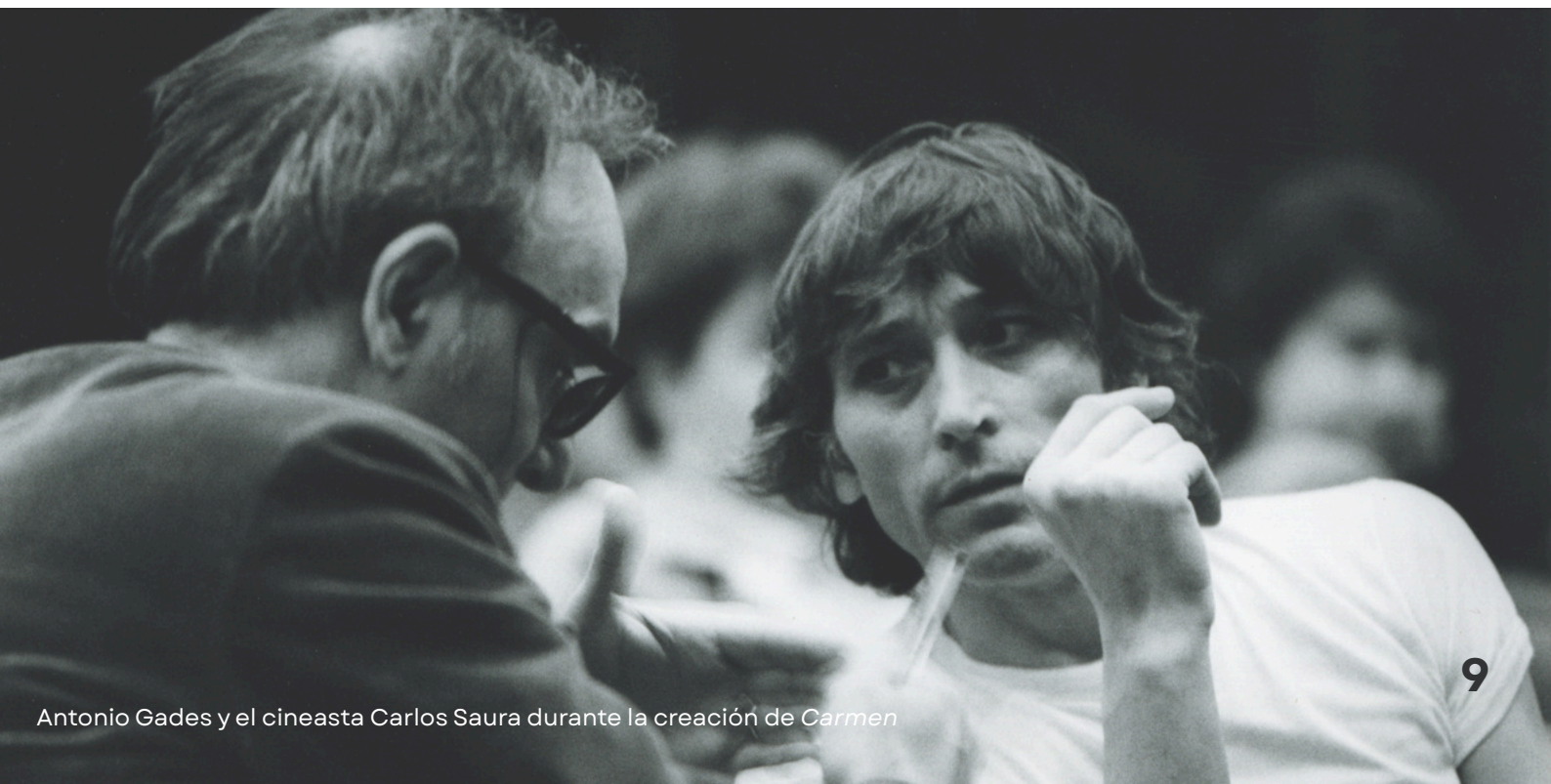
Antonio Gades y el cineasta Carlos Saura durante la creación de Carmen

29 de abril, Día Internacional de la Danza. Con la colaboración de la Compañía Antonio Gades. Coloquio y 420 asistentes